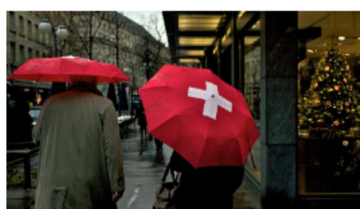
Jornal de Negócios

"A desinformação vai aumentar. Há uma polarização brutal nas próximas eleições"