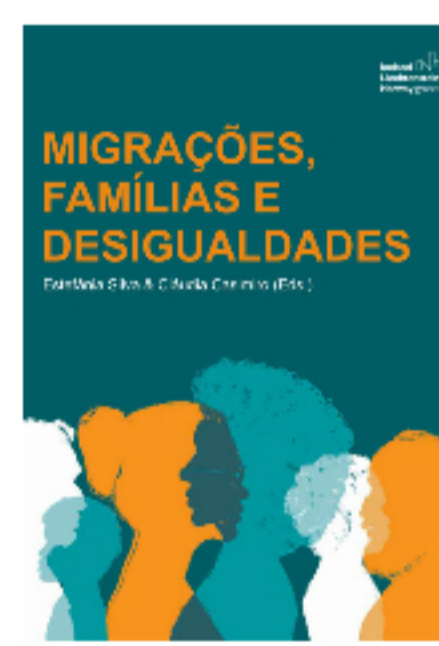
Capítulo de Livro

Investigação-Ação, Caminho para o Desenvolvimento do Serviço Social